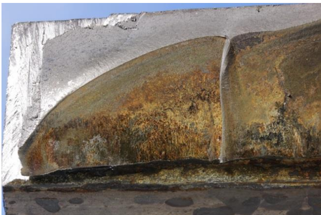
Schwingbruch im Zylinderblock eines Gaskompressors, ausgehend von einem Korrosionsangriff im Kühlwasserkanal (Makrofotografie)

Schäden können durch einen oder mehrere Faktoren hervorgerufen werden und sind oft vielfältiger Natur. Die heutigen, komplexen Wertschöpfungsketten mit mehreren involvierten Parteien (Abnehmer, Lieferanten, Unterlieferanten) führen häufig dazu, dass es im Schadenfall zu Rechtsstreitigkeiten kommt. Erst durch das Einschalten eines vertrauenswürdigen und neutralen Prüflabors können die Sachverhalte und Verantwortlichkeiten geklärt werden. Unsere Vertraulichkeit und Neutralität basieren auf unserem langjährigen Commitment und garantieren die systematische und objektive Abklärung von Schadensursachen sowie das Festlegen von Verantwortlichkeiten in technischer Hinsicht. Im Zusammenhang mit Spezifikationen, Pflichtenheften und Normen bieten wir ausserdem technisches Consulting und Sachverständigengutachten. Wir helfen Ihnen bei der Einleitung von Verbesserungen und Präventivmassnahmen für die Zukunft und sichern die Qualität Ihrer Produkte, damit Ihr Erfolg auch in Zukunft auf solidem Grund wachsen kann.